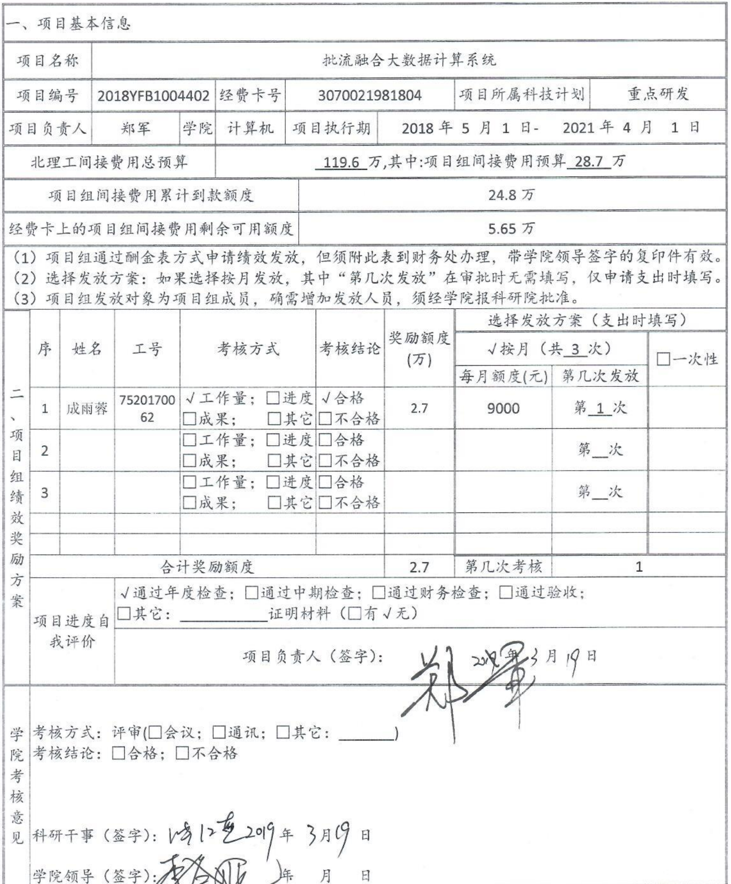
北京理工大学纵向科研绩效考核及发放方案表

注: 此表由项目组留存, 复印件有效; 发放绩效酬金时, 须附该表; 此表的第一、二部分内容将在校内进行信息公开。