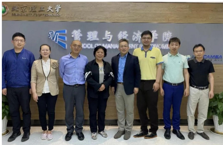
《沟通的力量》国家课程思政示范课教学名师团队