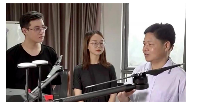
陶然指导学生科技创新