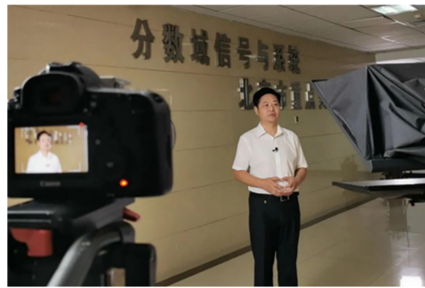
陶然录制“信号处理理论与技术”系列课程