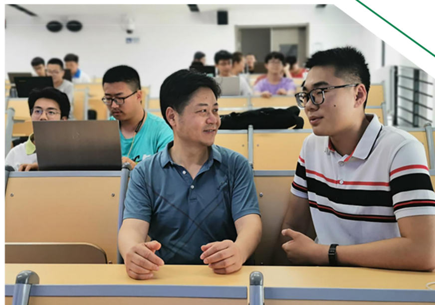
陶然与学生交流讨论