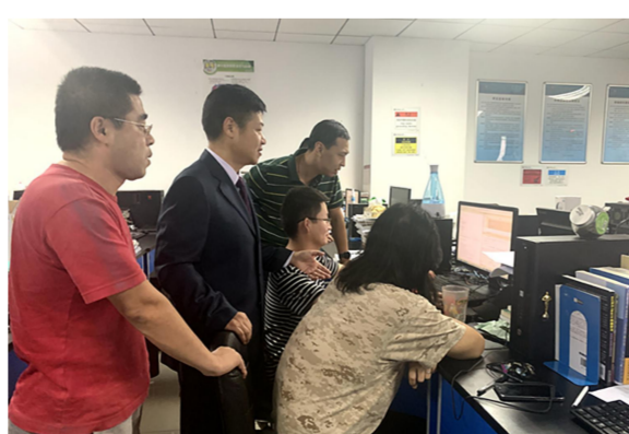
陶然指导学生实验