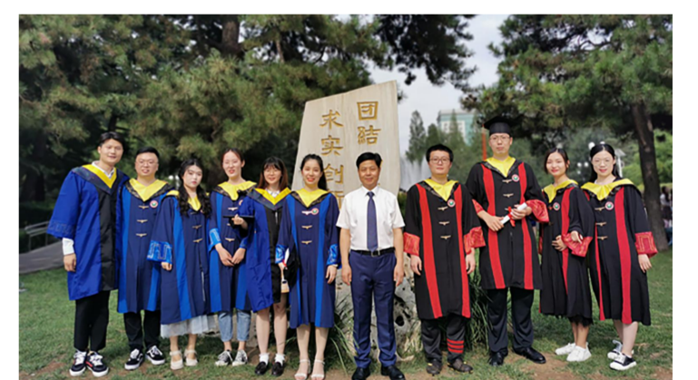
陶然与毕业生合影