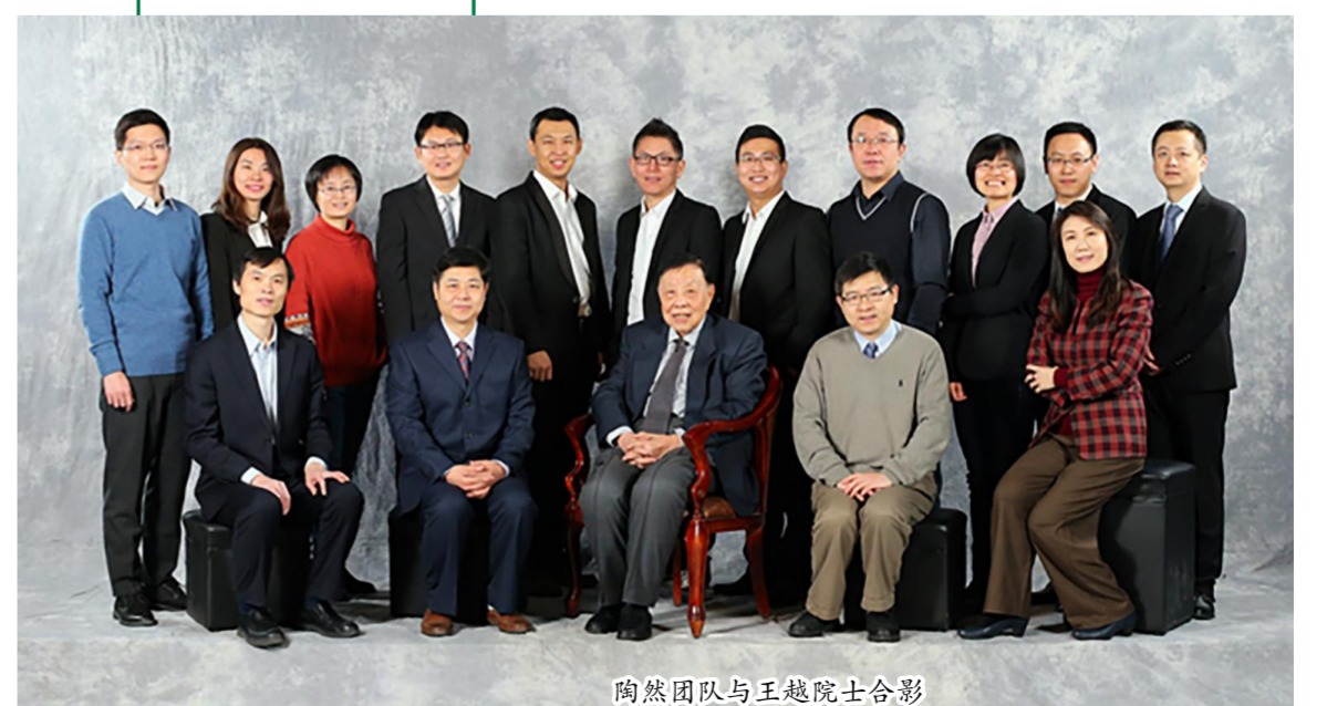
陶然团队与王越院士合影