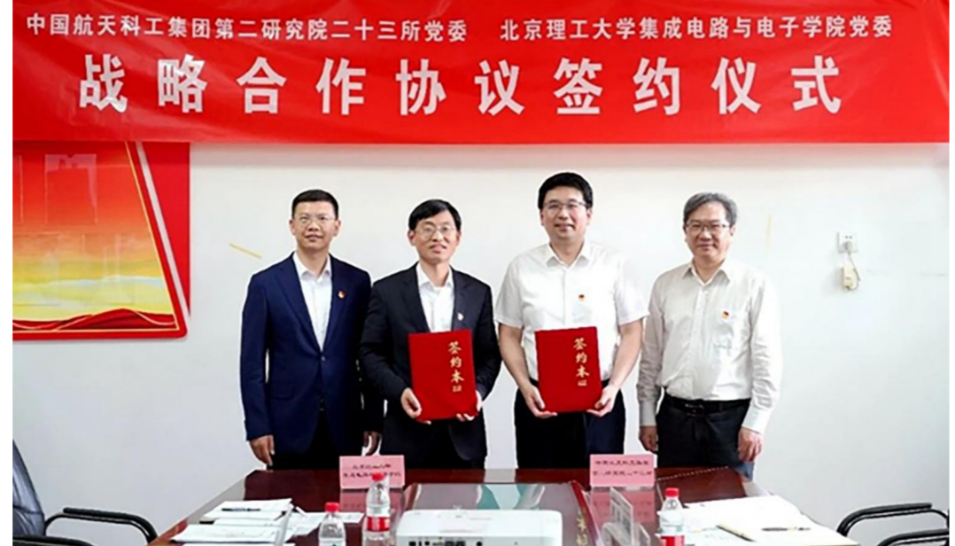
集成电路与电子学院与航天二院二十三所开展主题教育联学共建暨战略合作协议签署仪式

两年来，学院各项事业蓬勃发展，师生规模不断壮大，学生重要科研成果不断产出，涌现出一批优秀学子。面向未来，集成电路与电子学院将乘着新一轮科技革命和集成电路产业变革的东风，为建设世界一流集成电路与电子学院、为服务国家重大战略和经济社会发展、“中国芯”的崛起贡献北理工的力量！ (集成电路与电子学院)