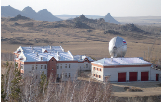
图 2 俄罗斯阿塔伊天文台 Fig. 2 Russian Altay station; panorama

该站址的优势是改进了 LLR 台站网的经度分布,劣势是纬度太高,与 Apache 台站比较可能会失去 15% 的观测机会。新台站的业务中,应用天文研究所将主要负责软件业务支持和以下工作: