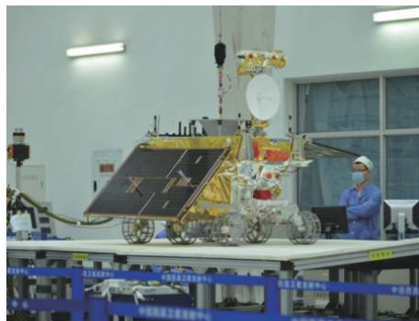
图4 组合面试验 Fig. 4 Composite surface test of rover

针对飞行产品,为了在模拟低重力环境下测试星球车移动性能、导航与控制性能,在洁净厂房中进行组合面试验,通过设置障碍、斜坡等典型地形,测试星球车的系统性能,如图4所示。