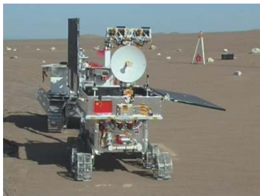
图3 外场试验 Fig. 3 Field test of rover

通过实地考察,并对考察地的地形地貌、气候等多方面资料加以分析,月球车外场最终选择在敦煌西北207 km的库姆塔格沙漠边缘,位于罗布泊东部,雅丹地貌的西侧。月球车外场试验如图3所示。