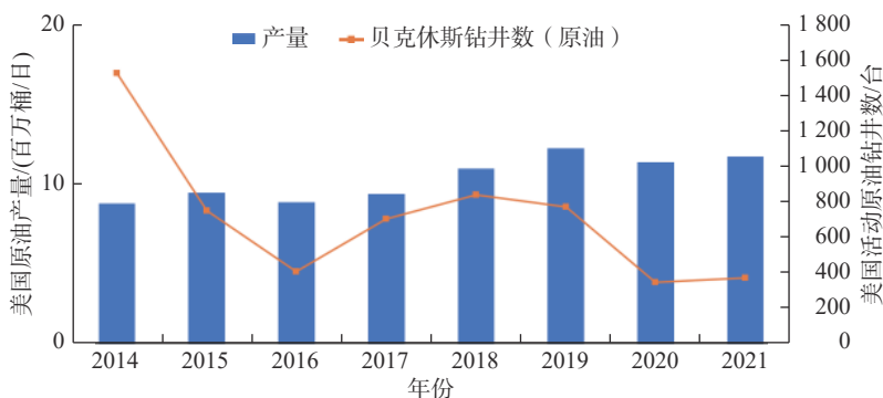
图2 2014—2021年美国原油产量与活动钻井平台数变化图

美国原油产量逐步回升, 未来增速或超预期。尽管受到页岩油行业资本开支纪律转向和美国传统能源政策转型等限制, 2021年美国贝克休斯钻井数仍然缓慢、稳步上升(如图2所示)。随着年末主要产油州工人逐步回归工作岗位, 预计原油钻井数将快速增加, 未来产量或将超出预期。据EIA估计, 2022年美国原油产量将增加至平均1180万桶/日 [4] 。