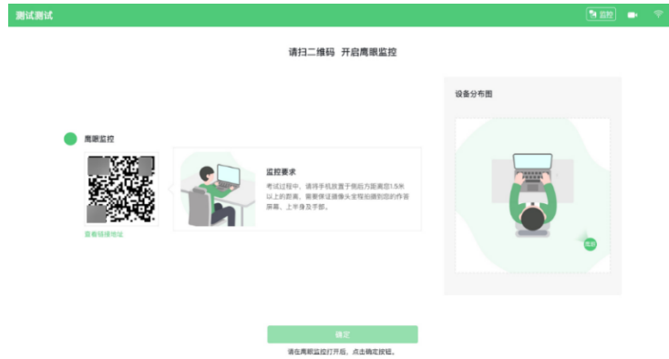
图 8 监考机登录