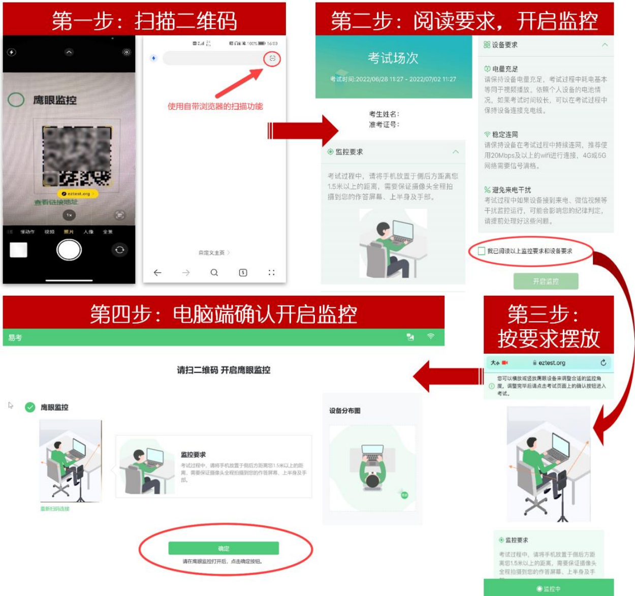
图 9 开启监考机监控步骤图