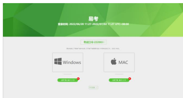
图 1 易考客户端下载