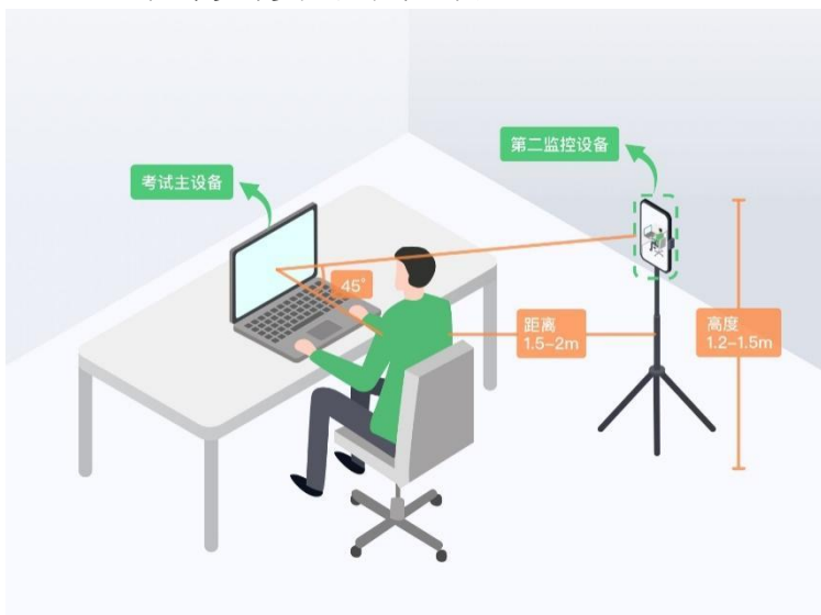
图 11 监控环境示意图