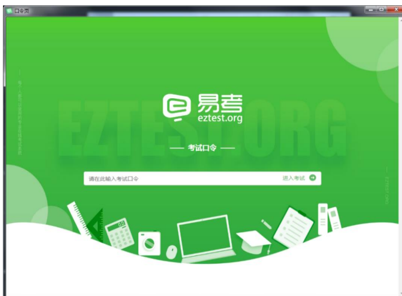
图 2 考试口令页

请注意：正式考试与设备调试、模拟考试的口令不同，请考生注意查看主办方通知，切勿使用错误的口令以免错过考试。