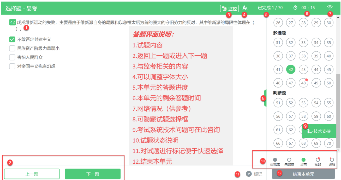
图 10 答题界面