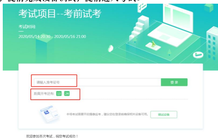
图 5 考试登录

完成调试后，可在允许登录的时间段内，输入准考证号登录。（登录时间等要求请参见考试通知）强烈建议考生预留出时间，提前完成设备调试，提前进入考试。