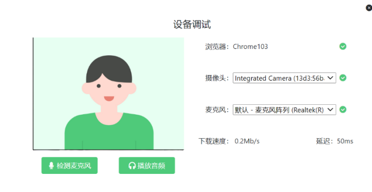
图 4 设备调试 2

请注意：一旦完成登录，考试系统将全屏锁定电脑的操作界面。强烈建议在输入准考证号进入考试前，进行设备调试，确认考试设备的可用情况。