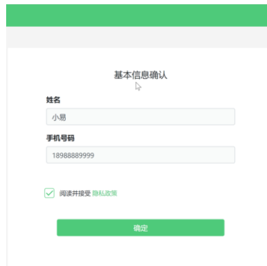
图 6 基本信息确认

请注意： 在进入考试之前，考生可点击《隐私政策》链接查看详细内容，确认接受《隐私政策》后可继续进入下一步。