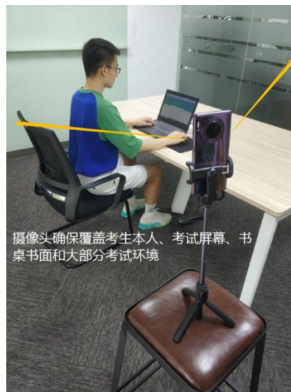
图 15 监控环境实景图

请注意： 考试过程中采集的监控信息，将只允许考试主办方查阅，作为判定考生是否遵守考试规则的辅助依据；不会用在除此之外的其他用途。