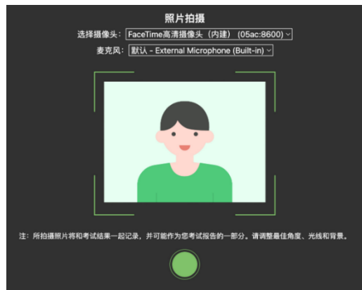
图 7 拍摄登录照

登录照片是考后主办方核验参考考生身份的重要凭证之一，请确保拍照时光线充足、图像清晰，照片应包括考生完整的面部和肩部。