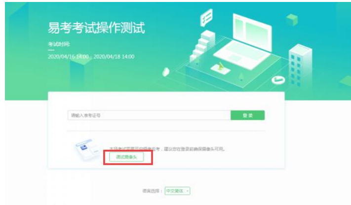
图 3 设备调试 1

请注意：一旦完成登录，考试系统将全屏锁定电脑的操作界面。强烈建议在输入准考证号进入考试前，进行设备调试，确认考试设备的可用情况。