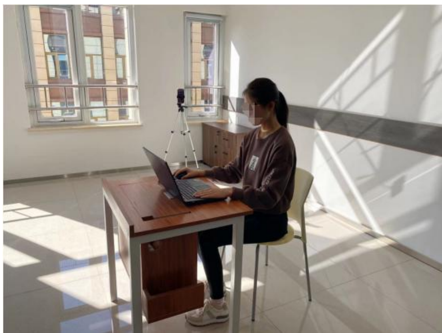
图二：手机监控摆放位置正面视角