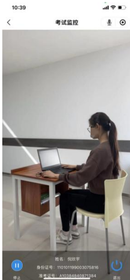
图四：手机监控录制视角