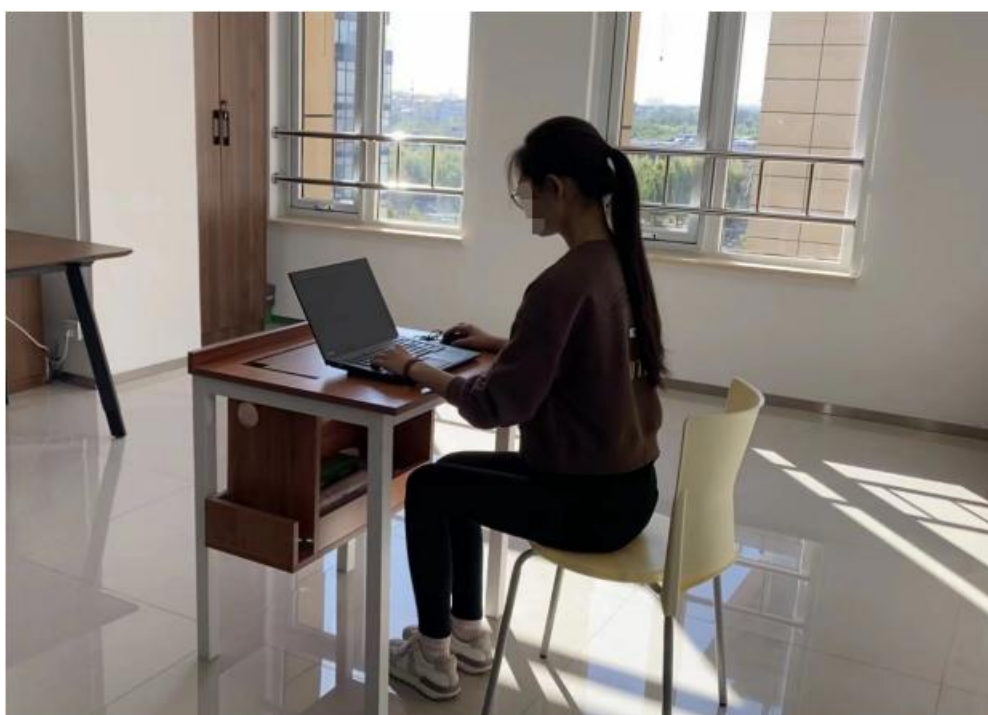
图三：手机监控位置视角